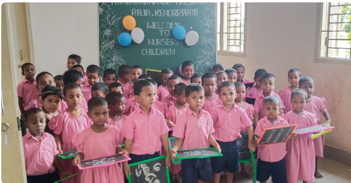
Fanno già parte della calorosa famiglia del Balashram.