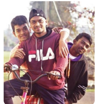
Pantu barátaival (a háttérben)