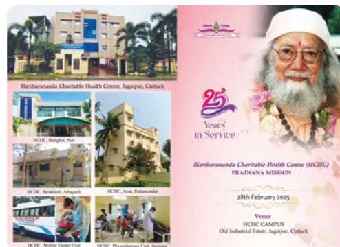
Meghívó a HCHC 25 éves jubileumi ünnepségére