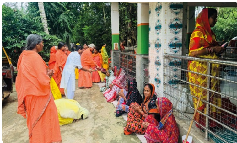
Férjük halála után sok özvegyasszony kénytelen az utcán küzdeni a túlélésért. A JNANAPRABHA MISSION étellel, ruházzal és orvosi segítséggel látja el őket.