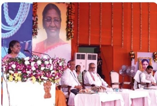
Droupadi Murmu indiai elnök meghatározó beszédet tart a JNANAPRABHA MISSION alapító ünnepségén