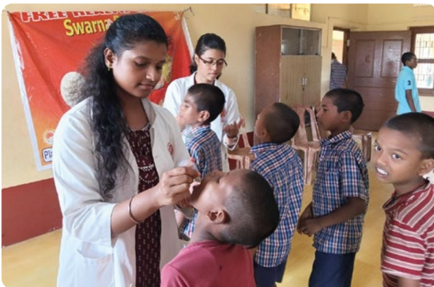
A Balashram tanulói ajurvédikus immunerősítőt kapnak.