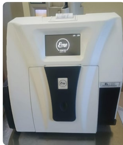
A 2024/25-ös pénzügyi évben az Önök adományainak köszönhetően egy 3p elektrolit-elemző készüléket vásároltunk.