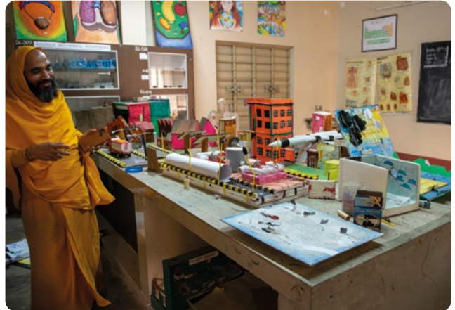
A diákok a záróvizsgákra készülnek.