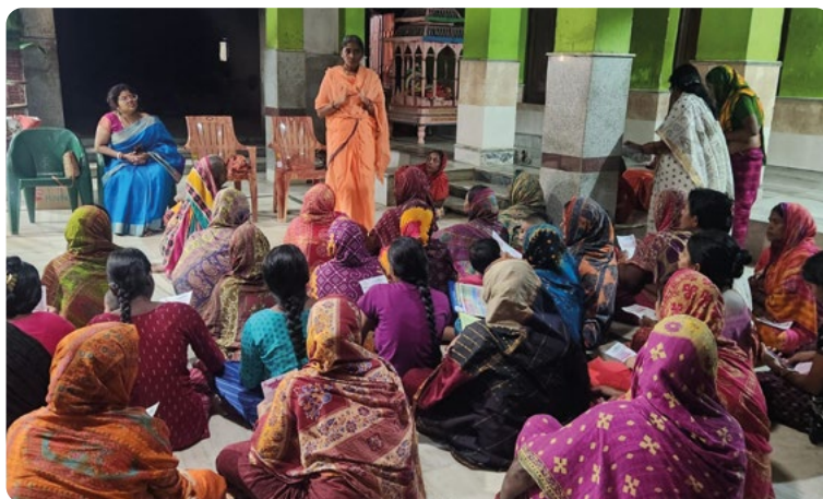
En las zonas rurales de la India, las mujeres siguen sin tener prácticamente voz. La JNANAPRABHA MISSION trabaja por el bienestar de las madres y sus hijas, con el objetivo de empoderar a las mujeres y reforzar su autoestima.