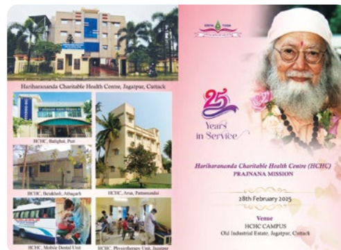
Invitación a las celebraciones del 25º aniversario del HCHC