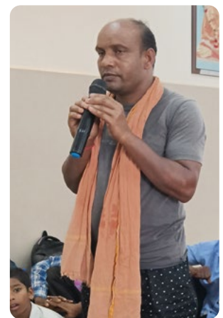
En las reuniones de padres y profesores (como la que se celebra aquí en octubre de 2024), las madres y los padres comparten su alegría y gratitud por las nuevas oportunidades que se presentan en la vida de sus hijos.