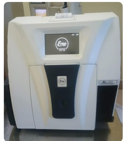
En el ejercicio financiero 2024/25, se adquirió un analizador de electrolitos de 3 p gracias a vuestra donación.