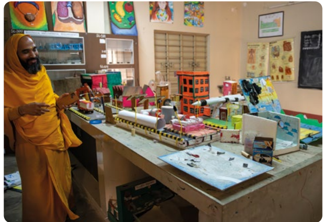
Los alumnos se están preparando para sus exámenes finales.