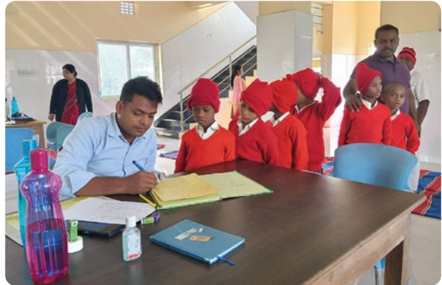
Los niños están siendo inscritos para su revisión ocular.