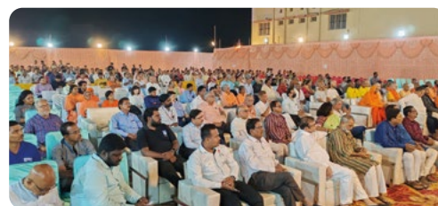
Muchos visitantes en las celebraciones