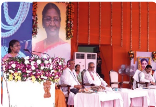
La presidenta de la India, Droupadi Murmu, pronunciando su emotivo discurso en la ceremonia de fundación de la Misión Jnana Prabha.