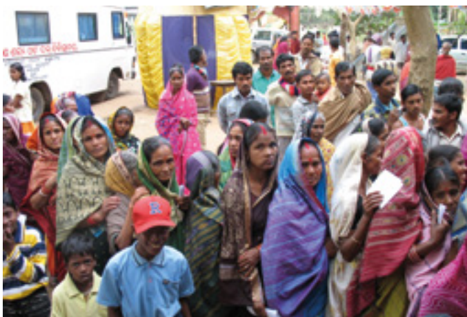
Toma de fotos en la ceremonia inaugural del HCHC Centro de día en Jagatpur el 14 de febrero de 2014.