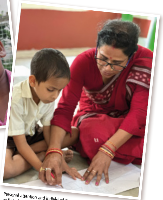
Personal attention and individual support are of central importance at Balashram.

El colegio reportó sobre los esfuerzos para ofrecer a los graduados, después del 10º grado y después del 12º grado, programas apropiados que se desarrollan de manera cooperativa con socios corporativos. Estos socios ofrecerían formación profesional o puestos de trabajo a nivel de entrada a aquellos estudiantes que se distinguen en un cierto ámbito. También se ofrece información sobre carreras y formación de habilidades desde varios sectores que son invitados al Balashram para enseñar habilidades prácticas a los niños, como coser, reparar bicicletas o ordenadores, peluquería, cocinar y jardinería. Nos contaron que el programa de la ESO se ampliará también y que a los alumnos les gustan sobre todo las actividades de tiempo libre, como música y danza hasta deportes y exploraciones.