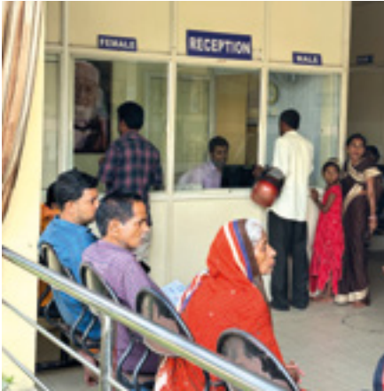
Mucha gente espera aquí los resultados de sus placas o de pruebas de sangre. Afortunadamente, ambos se han hecho realidad aquí en el centro desde hace ya algunos años.

de febrero de 2020. El hecho de que ahora se pueda hacer pruebas de sangre y placas en el HCHC, es crucial para hacer diagnóstico. Para mucha gente, que muchas veces llega a pie y desde regiones remotas de Odisha, este servicio en primer lugar permite hacer tratamientos muy detallados, y porque todo es gratuito para los pobres.