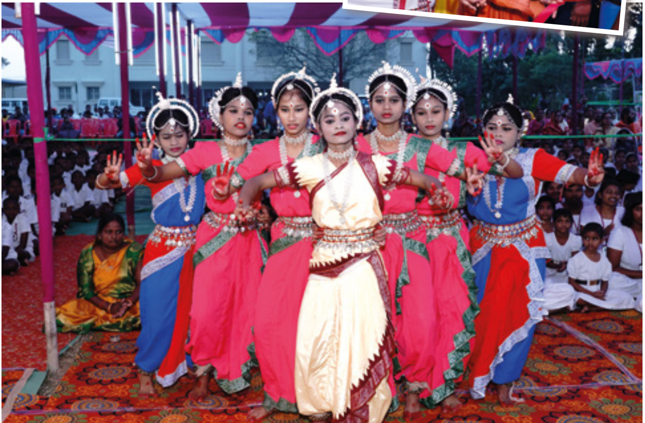
Niñas del Balashram haciendo una función para honrar la visita de prof. Ganesh Lal, Gobernador de Odisha.