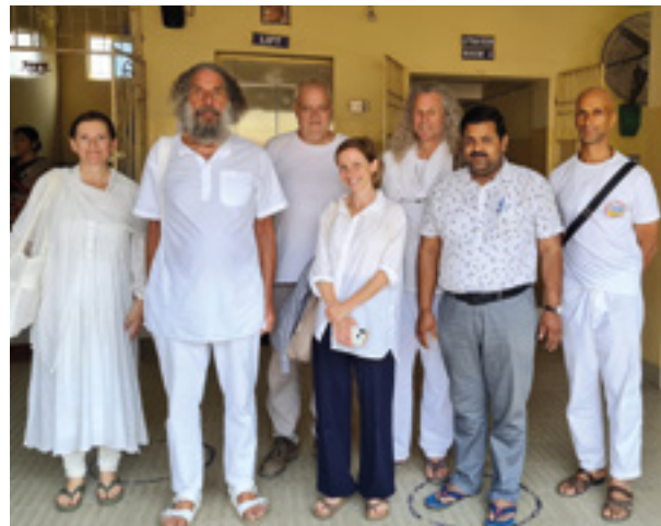
Miembros de HAND IN HAND Austria, Francia, los Países Bajos y Suiza con el gerente de HCHC de Jagatpur en el hall.

Por ejemplo, equipaje de análisis importante para medir hasta 300 parámetros dentro de 10 a 20 minutos y el hardware y software para documentar historias médicas. Y, en la primavera de 2020, el muy esperado servicio de radiología comenzó a ser operativo también.