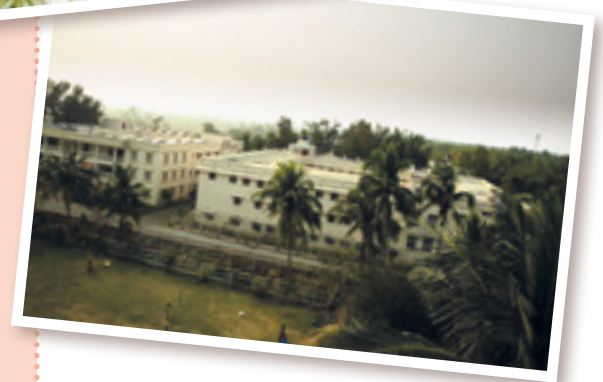
En 20 ans, le Balashram est devenu un campus impressionnant. À ce jour, 922 enfants y ont trouvé un foyer, 244 ont déjà déménagé dans le monde et 121 sont venus à la première réunion des anciens.