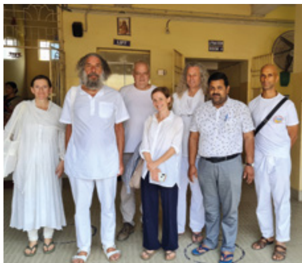
Des membres de HAND IN HAND Autriche, France, Pays-Bas et Suisse avec le directeur de Jagatpur HCHC dans la zone d'entrée.

Par exemple, un équipement d'analyse important qui peut mesurer jusqu'à 300 paramètres en 10 à 20 minutes, ainsi que du matériel et des logiciels pour documenter les antécédents médicaux. Et, au printemps 2020, le service de radiologie tant attendu a également commencé à fonctionner.