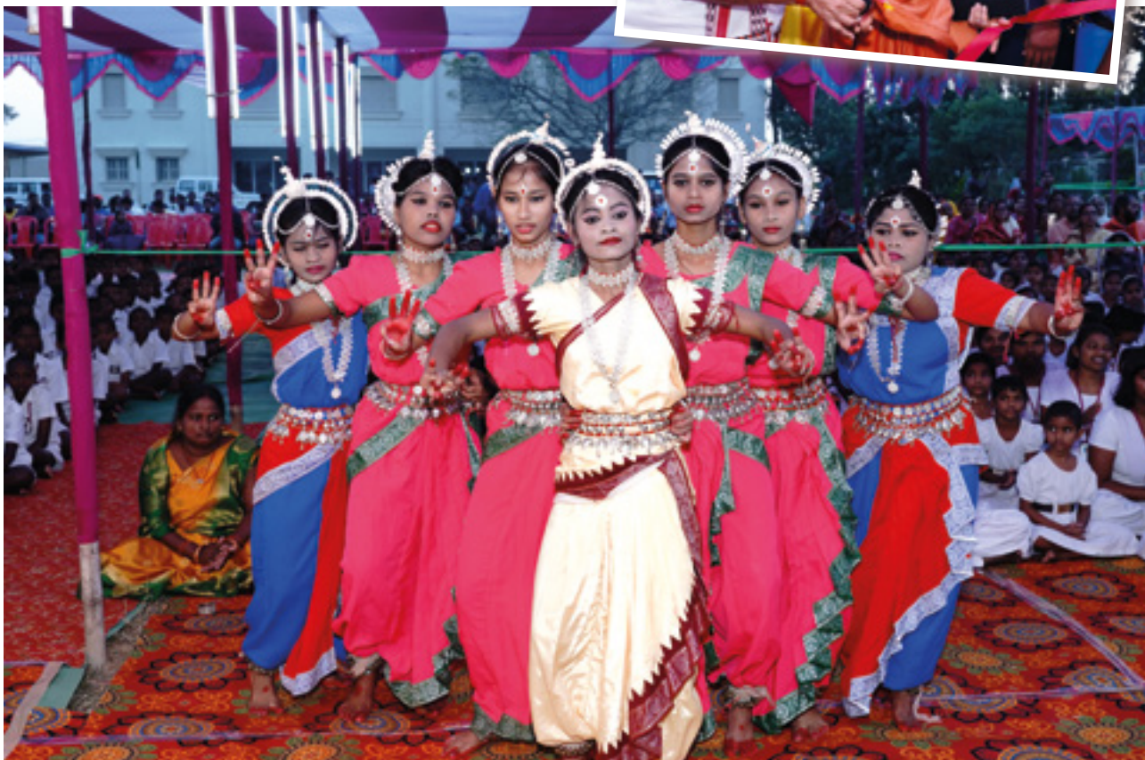
Les écolières du Balashram donnent un spectacle de danse en l'honneur de la visite du professeur Ganesh Lal, gouverneur de l'Odisha.