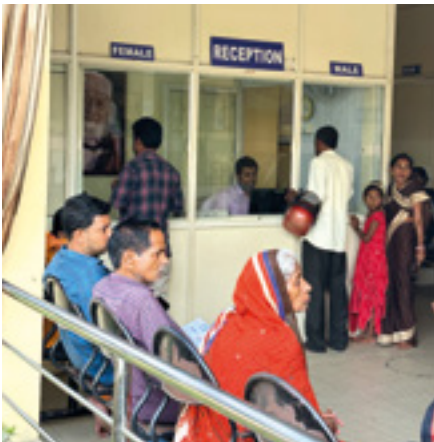
Beaucoup de gens attendent ici les résultats de leurs radiographies ou de leurs tests sanguins. Heureusement, les deux sont possibles ici sur place depuis plusieurs années maintenant.

Pour de nombreuses personnes, qui viennent souvent à pied et depuis des régions éloignées de l'Odisha, ce service est ce qui rend possible un traitement en profondeur en premier lieu – et, en second lieu, parce que tout est gratuit pour ceux qui en ont besoin.