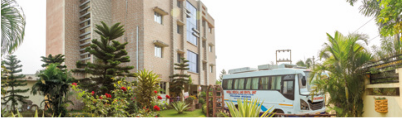
HCHC Jagatpur 2014 (clinique de jour)

les réguliers, et des services dentaires et de physiothérapie sont offerts deux fois par mois. Des services de prévention sont également en cours de développement à HCHC Balighai; Actuellement, le yoga est gratuit.