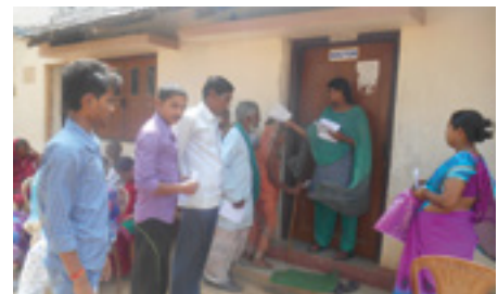
VHP Arua 2010