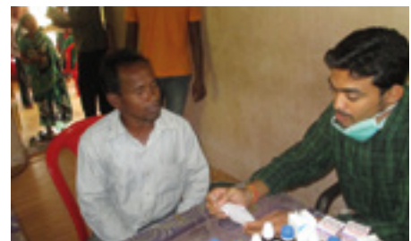
VHP Athagarh 2012