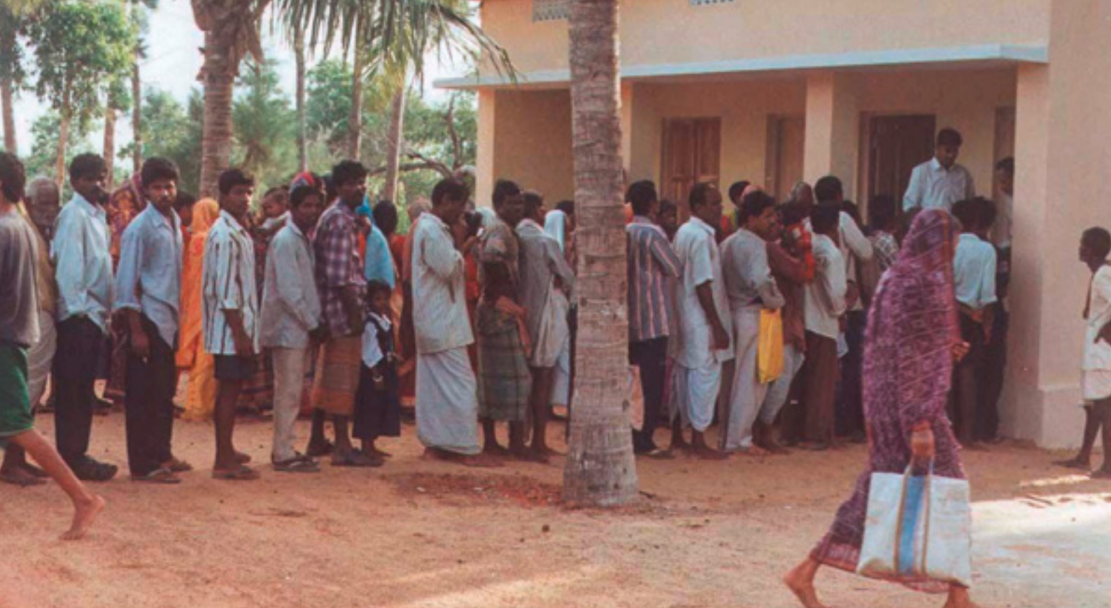
HCHC Balighai 2000