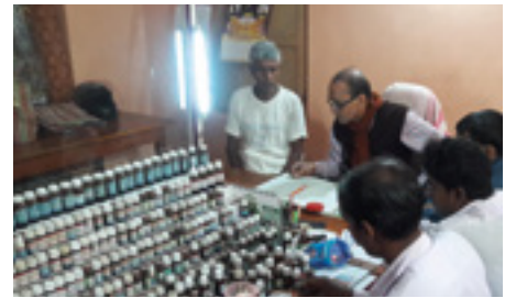
HCHC Bhisindipur 2004