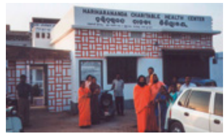
HCHC Jagatpur 1999